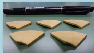
特殊扇形形状 TiN処理Nd磁石 用途：横浜国大 藤本先生 Spiral Motor

株式会社 KRI フェロ&ピコシステム研究部 Tel: 075-322-6832